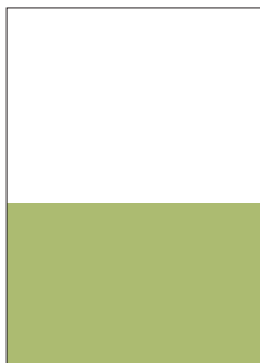
Format 1 98 x 148 mm

Alle Formate werden 4-farbig (ohne Sonderfarben) gedruckt. Alle Anzeigenformate zzgl. 2mm Beschnitt.